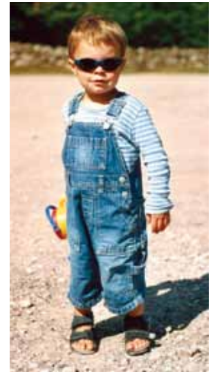
Eine frühe Allergiediagnostik ist sinnvoll, weil wir mit unseren Maßnahmen den Krankheitsverlauf des Allergikers heute oft günstig beeinflussen können.

Allergien beschreiben eine Überempfindlichkeit unseres Immunsystems gegen eigentlich ungefährliche, körperfremde Stoffe (= Allergene). Die Entstehung einer Allergie kann in jedem Alter erfolgen, wenn das Immunsystem einen Stoff fälschlicherweise als gefährlich einstuft und eine »allergische« Reaktion dagegen einleitet. Für Allergien gibt es sehr viele unterschiedliche Auslöser. Zu ihnen zählen unter anderem Pollen (Gräser- und Baumpollen), Tierhaare oder Hautschuppen, Milbenkot, Insektengifte, Nahrungsmittel, Schimmelpilze und andere Mikroorganismen. In der nebenstehenden Tabelle ist dargestellt, wann man im Kindesalter an eine Allergiediagnostik denken sollte.