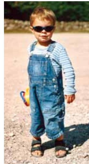
Eine frühe Allergiediagnostik ist sinnvoll, weil wir mit sekundär- und tertiär-präventiven Maßnahmen den Krankheitsverlauf des Allergikers heute oft günstig beeinflussen können.