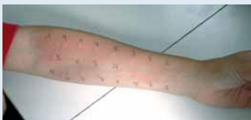
Bei der Haut-Prick-Testung muss immer eine Positiv- und Negativkontrolle mitgeführt werden. Die Dokumentation der Testreaktion erfolgt im Praxisalltag durch Ausmessen des Quaddeldurchmessers in mm.